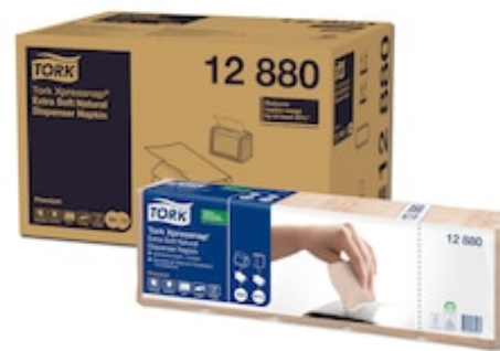
Tork XPN Sv Ench. blc 2P 200/5/8 N4 12880