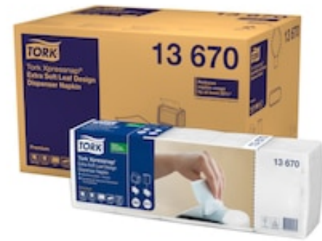
Tork XPN Serv Ench Extra Doux Décor Blanc 13670