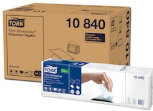
Tork serv. pour dist. 1p 4F 225/5/8 (N4) 10840