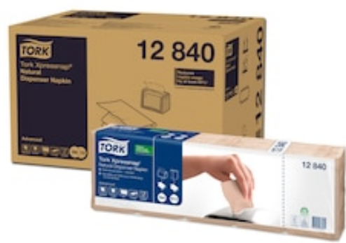
Tork XPN Sv Enchev.Naturel 1P 225/5/8 12840