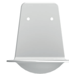
Coupelle stop gouttes (AC0170)