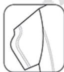
Manches avec découpes