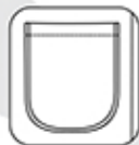
Poche basse plaquée finition biais