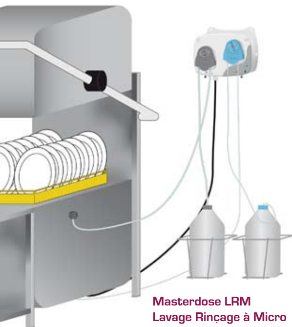
Masterdose LRM Lavage Rinçage à Micro

DOSAGE ÉLECTRONIQUE • VAISSELLE • CUISINE PROFESSIONNELLE