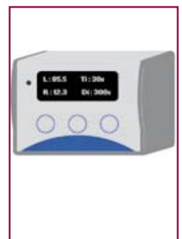
Afficheur Nouvelle génération