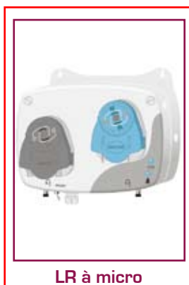
LR à micro

Visualisation des réglages avec l'afficheur nouvelle génération.