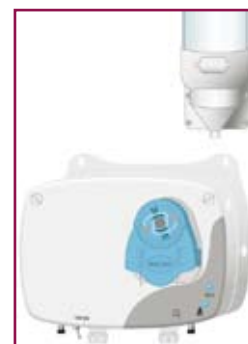
PR à micro