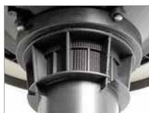
SYSTÈME ANTI-MOUSSE INTÉGRÉ