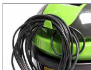
CROCHET POUR CÂBLE