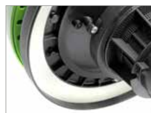
JOINT DE TÊTE NOVATEUR