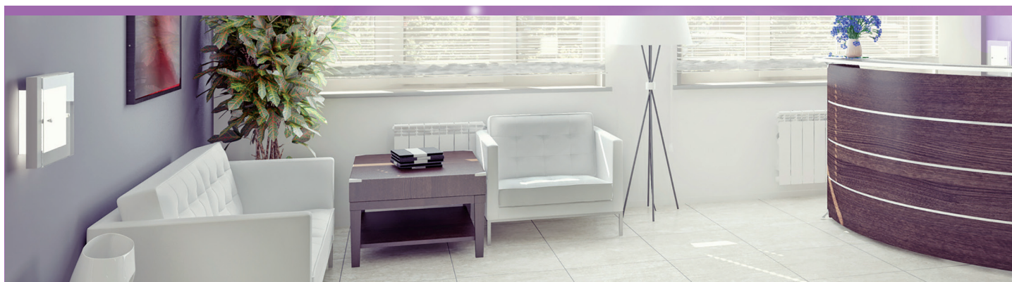
Ambiance, Citron vert, Lavande, Pamplemousse

Dans tous les locaux où règnent des mauvaises odeurs : certaines sont communes (odeurs de toilettes, humidité, ou résultant d'une mauvaise aération), d'autres sont spécifiques, permanentes ou instantanées (restaurants, tabac, salles de sport, transports en commun).